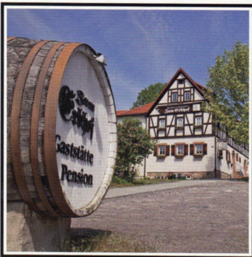
Gaststätte & Pension